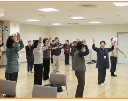
②みんなと一緒に、笑って、学んで、楽しいひとときになりますよ!