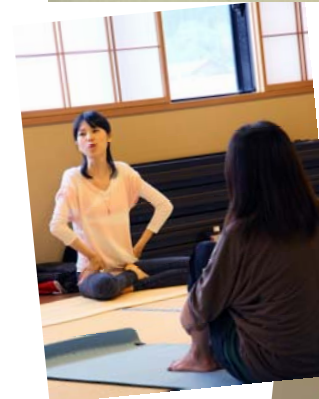
体、呼吸、ココロ と向き合い リフレッシュ～