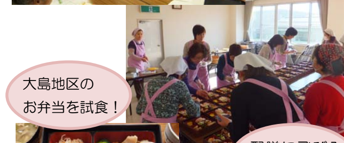
大島地区のお弁当を試食！