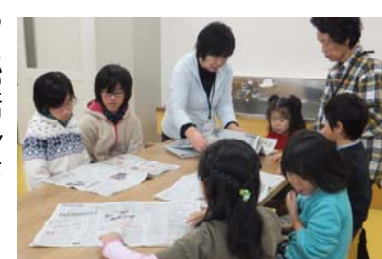
11/26 紙粘土・おりがみ