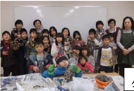
12/3 クリスマスリースづくり