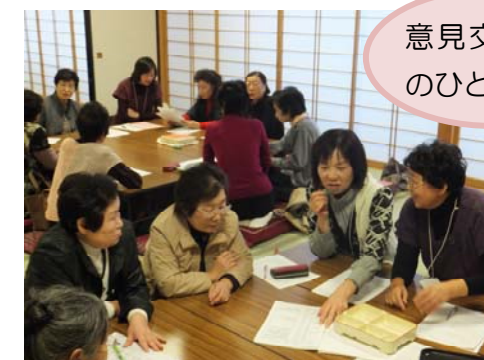
意見交換会でのひとコマ